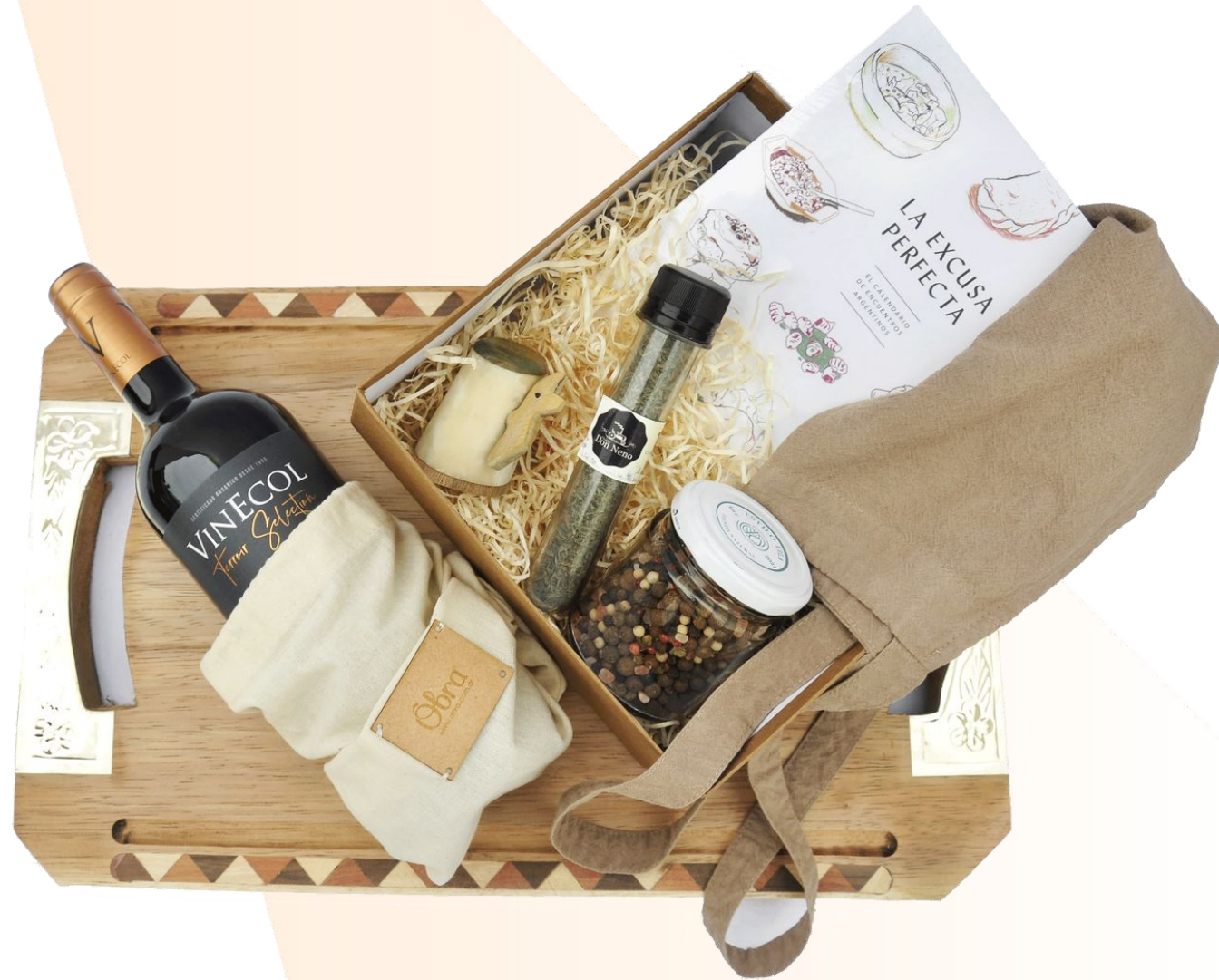
Tabla de madera elaborado por artesanos de Salta, con terminaciones en alpaca Salero de palo santo y hueso de comunidad Wichi de Salta Especias y sales saborizadas de pequeños productores. Delantal confeccionado por Asociación Sahdes, quienes ayudan a mujeres en situación de vulnerabilidad social. Vino orgánico de producción mendocina Libro temático de pequeña editorial independiente